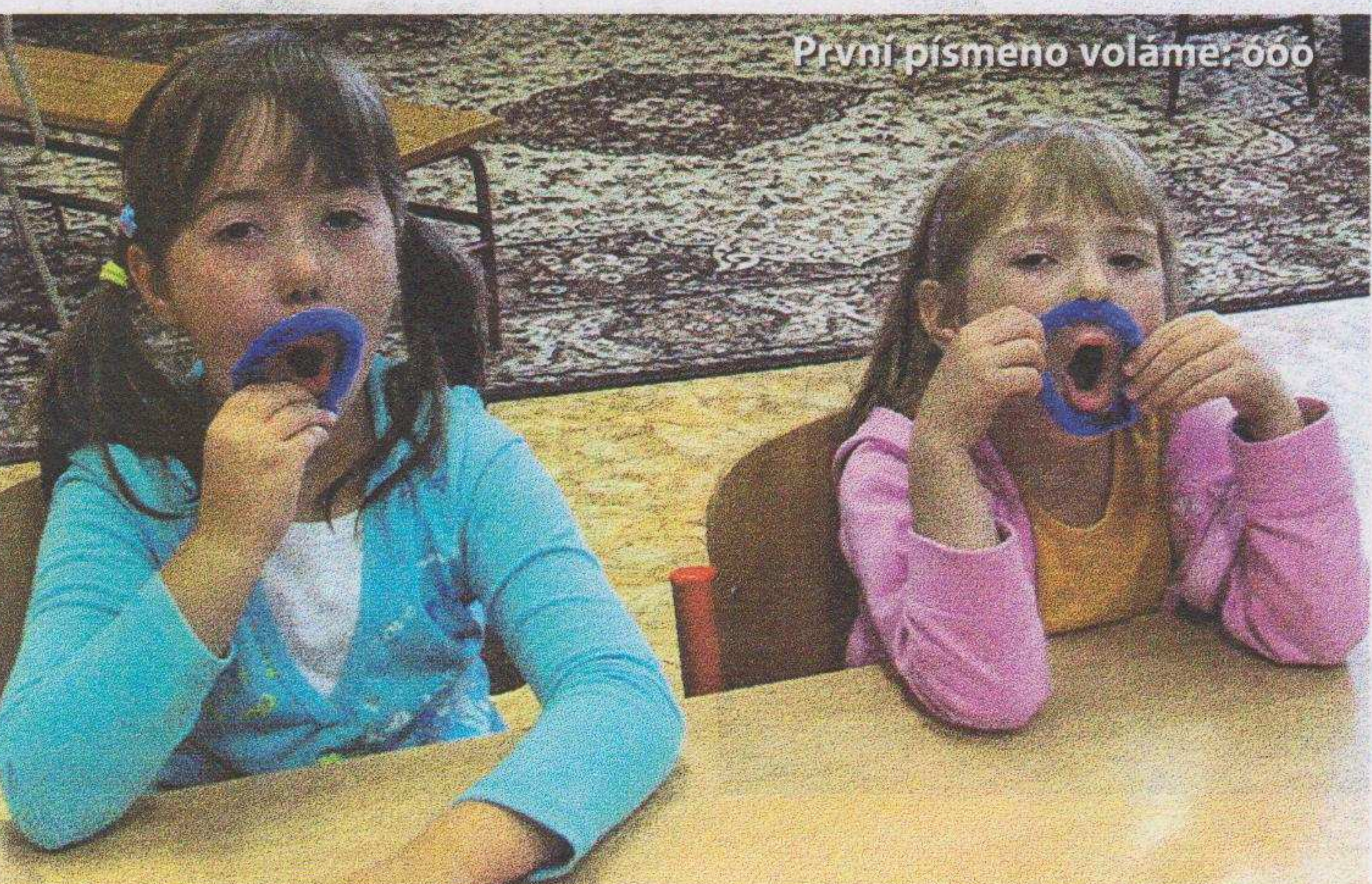
První písmeno voláme: ooo